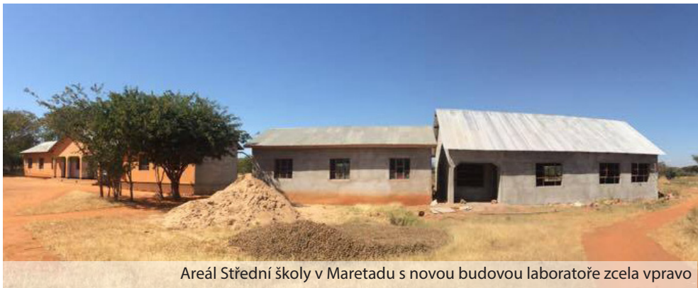
Areál Střední školy v Maretadu s novou budovou laboratoře zcela vpravo