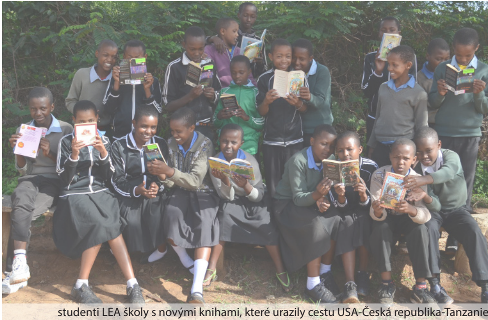
studenti LEA školy s novými knihami, které urazily cestu USA-Česká republika-Tanzanie