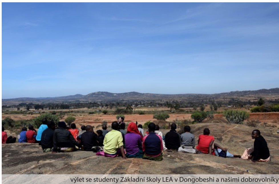
výlet se studenty Základní školy LEA v Dongobeshi a našimi dobrovolníky