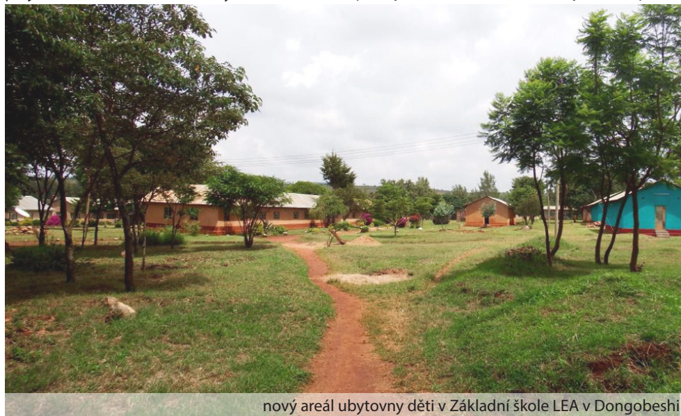
nový areál ubytovny dětí v Základní škole LEA v Dongobeshi

Mějte krásný sněhový leden, a spolu pracujeme na Božím díle jako doposud.